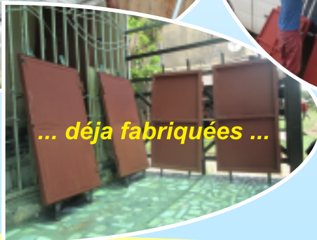
... déjà fabriquées ...