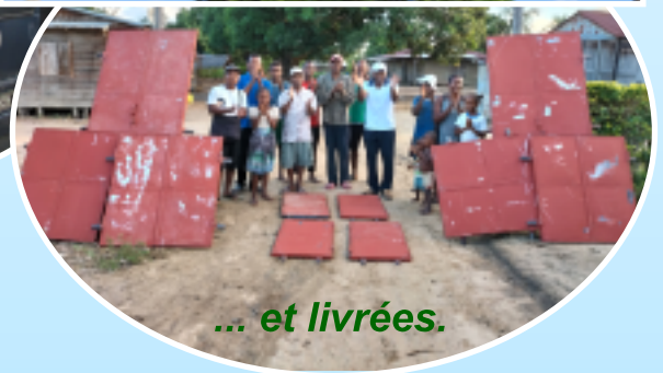
... et livrées.