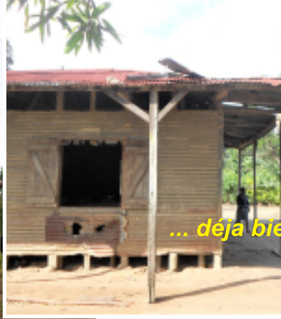
... déjà bien détérioré avant