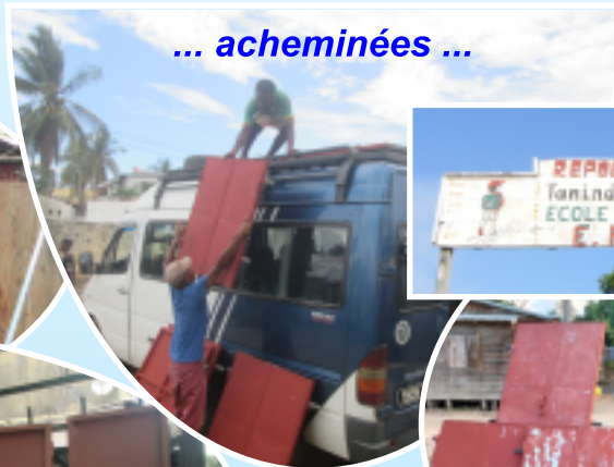
... acheminées ...